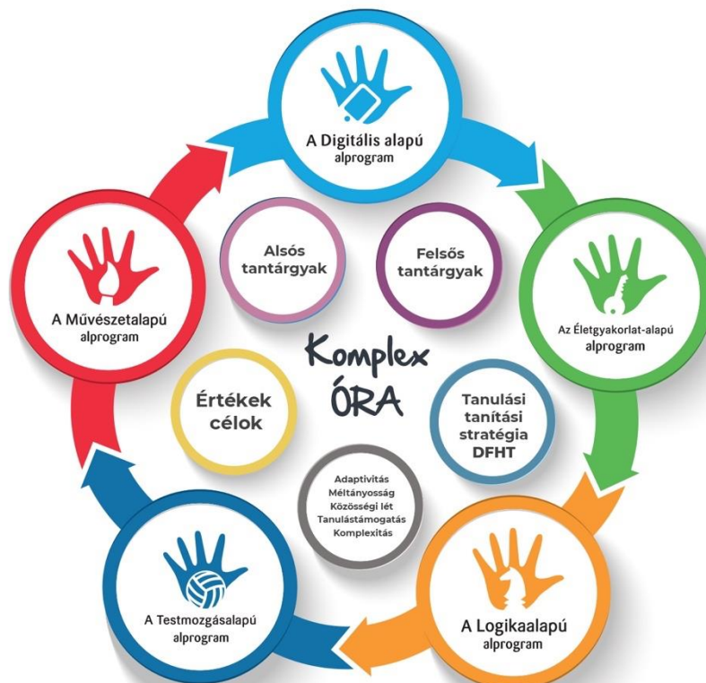
A Komplex órák felépítése